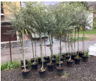
Piante di 4 anni