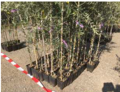
Piante di 2 anni

Newsletter no. 1 del 15.3.2021 sul sito www.amicidellolivo.ch