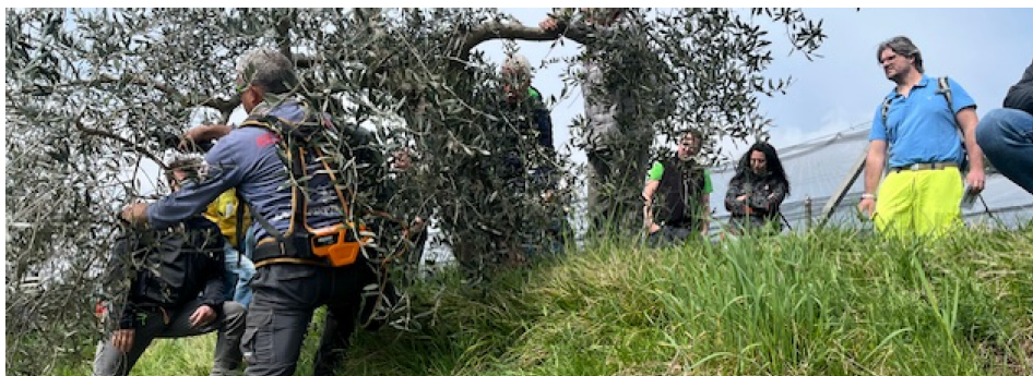
Colle degli Ulivi 2025 a Coldrerio