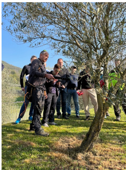
Oliveto a Rancate 2025